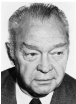
Torsten Nilsson (1905-1997)

Torsten Nilsson var i likhet med Per Albin Hansson murarson från Skåne. Han avlade realexamen och studerade därefter vid yrkesskola och folkhögskola. Trots att realexamen (en bra bit på väg till studentexamen) på den tiden i regel ledde över till något slags tjänstemannabefattning valde Nilsson samma yrke som fadern och arbetade 1922–1929 som murare. Han inledde sin politiska karriär 1927 och avancerade via SSU (Sveriges socialdemokratiska ungdomsförbund) 1940 till posten som partisekreterare. Han blev 1941 riksdagsledamot och i samband med ministärombildningen 1945 kommunikationsminister men avgick först 1948 som partisekreterare. År 1945 blev Nilsson