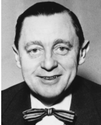
Jarl Hjalmarson (1904-1991)

Jarl Hjalmarson var i likhet med Torsten Nilsson född i Skåne, och närmare bestämt i Helsingborg. Men hans bakgrund var en helt annan. Fadern var officer med en komplicerad karriärväg bakom sig: överstelöjtnant i Svenska armén, general i Persiska armén och generalmajor i Finska armén.