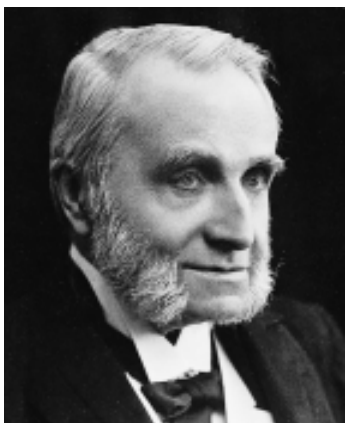
Adolf Hedin (1834–1905)

Hedin var prästson från Bo församling i Närke. Han avlade 1851 studentexamen och 1861 filosofie kandidatexamen vid Uppsala Universitet. Därefter påbörjade han en publicistisk verksamhet som skulle förfara till hans bortgång och som till den helt övervägande delen blev hans levebröd. Hans huvudorgan var i tur och ordning Upsala-Posten, Aftonbladet och Dagens Nyheter, samtliga liberala. Hedin anslöt sig tidigt till skandinavismen och förblev en ivrig internordist med särskilt starka band till Norge – även sedan skandinavismen efter dansk-tyska kriget 1863–1864 hade ebbat ut. Han publicerade 1867 i dagstidningen Fäderneslandet femton artiklar som frammet