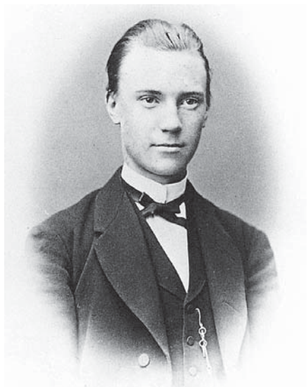
Gustaf Eneström (1852—1923) "En bibliotekarie för sig"